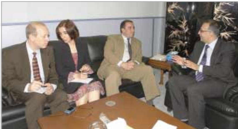
نا: کاروان کاکهیی

وێزیری رۆشنییری و لاوان د. کاوه مهحمود و شاکر پیشوازی له ئەلیکس لاسکاریس، سەرۆکی نووسینگەی بالتیۆخانەیی ولایەتەیه کەرتوووەکانی ئەمریکا له عێراق و دێل پرنس، سەرۆکی بەشی دیپلۆماتی گشتی تیمی ناوهدانکردنەوهی هەریمی کوردستان کرد، له دانیشتنەکهدا وێزیری رۆشنییری و