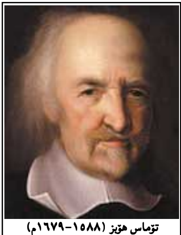
توماس هویز (۱۵۸۸-۱۶۷۹م)