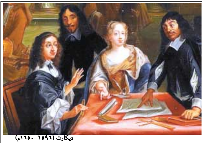
دی کارت (۱۵۹۶-۱۶۵۰م)

نه مه یه بهرنامه و ریبازی فلسفه فی که میژووی رووکه شی فلسفه فی بایه خ پیده دات سه بارهت به وهی نایا دی کارت رۆلی گونجانندی هه ردوو بۆچوونه کانی ده گتیرا له نیوان نهننولجیای مایه کیسه تی میکانیکی و نهننولجیای گیانی کولتوری، دهلیت: فلسفه فی دی کارت سازشکارانه نه بوو، به واتا باوه که ی، دی کارت هه ولیدا بوون دوو که رت پیشان بدات، جیهانی مادده و جیهانی گیان. نه وهشیان به کاریگه ری مایه کیسه تی میکانیکی و فلسفه فی زانست