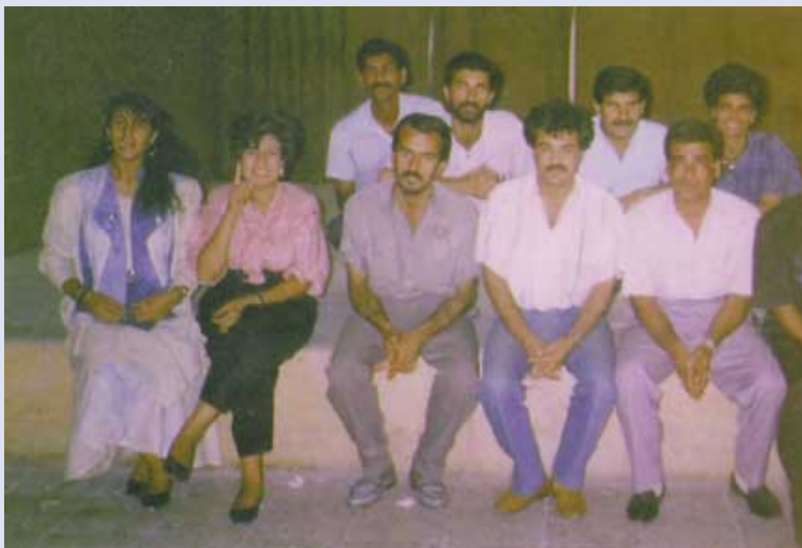
كامهران حاجي نه‌لياس

تيپي ئيبراهيم جه‌لال، له سالي 1991-2001 ماموستا بووه له په‌يمانگاي هونه‌ره جوانه‌كاني به‌غدا بۆ ساوه‌ي پينج سال سه‌روكي به‌شي نواندن بووه له په‌يمانگاي هونه‌ره جوانه‌كاني به‌غدا، راويژكار بووه له ته‌له‌فزيوني به‌غداديه. له سالي 2001 خه‌لاتي داھيتاني له فيستيقيالي قاهيره‌ي حه‌وته‌مي راډيو ته‌له‌فزيون وەرگرتووه كه بچووكترين نه‌كتەر بووه له‌ناو نه‌كته‌راني عه‌ره‌بي وه‌كو كه‌مال شه‌ناوي و نه‌حمه‌د زه‌كي و ميرفت نه‌مين. خه‌لاتي باشتين نه‌كته‌ر بۆ سالي 1977 به‌هوي بينيني رۆلي شاعيري گه‌وره حوسين مه‌ردان له شانۆگه‌ري خه‌مسه نه‌سوات، خه‌لاتي داھيتاني بۆ سالي 1977، 2001، 2002 وەرگرتووه ناوي هه‌ندئ له كاره‌كاني: (النجمه، خمسه اصوات، الزيب، الپاشا، الجراح، مناوي الپشا، الحب كان السبب، حكاكه) نه‌م هونه‌رمه‌نده له ته‌مه‌ني 48 سالي له‌به‌ره‌به‌ياني 2009/2/9 به‌نه‌خوشي له سوريا كوچي داويي كرد، له سه‌ر داخوازي و وه‌سيه‌تي خوي له رتيوره‌سميكي شايسته به ناماده‌بووني هونه‌رمه‌ندان و جه‌ماوه‌ريكي زور له به‌غدا به‌خاك سپيڤردا. سلاو له گياني پاكي هونه‌رمه‌ندي مه‌زن عه‌بدو‌لخالق موختار بيٽ.