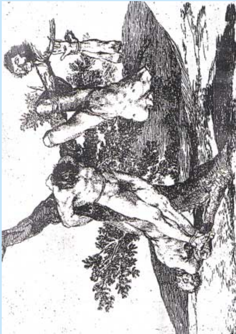
گۆیا . زنجیرە گرافیکی : (کارەساتی جەنگ) لیستی ژمارە (۳۹). ۱۸۱۱ - ۱۸۱۲