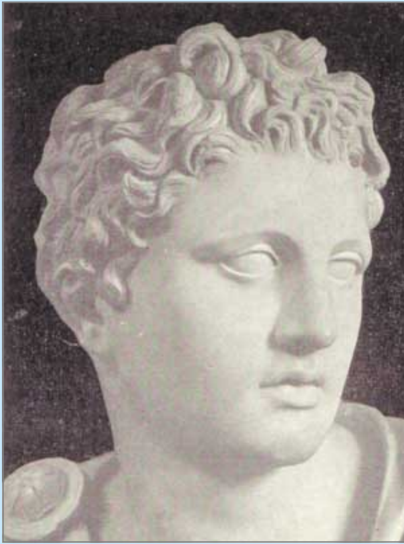
سکۆپاس. پۆرتريٽ. سهدهی چوار.پ.ز