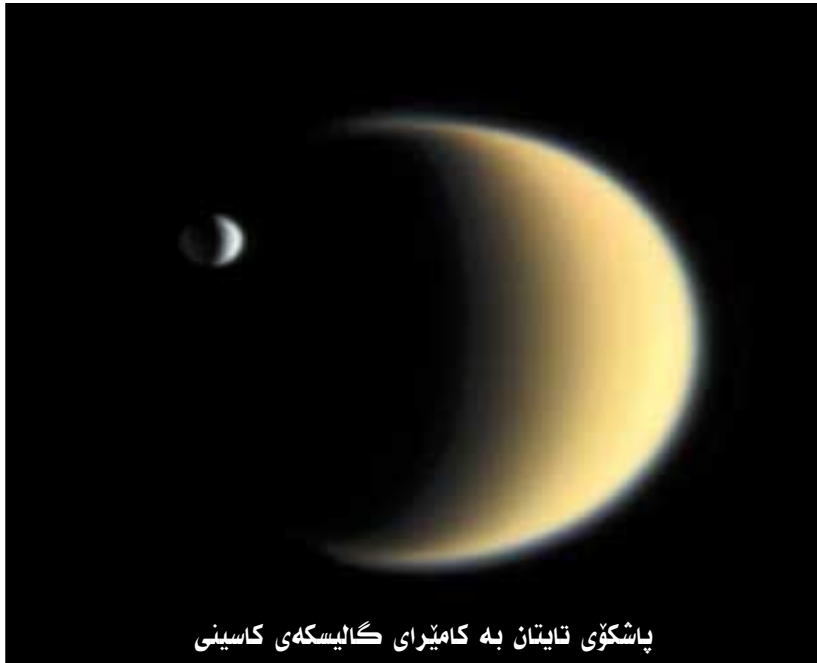
پاشکۆی تایتان به کامیرای گالیسکه‌ی کاسینی

هوره، کانی بووه، به‌لام نه‌مجاره‌یان له‌ئاستیکی به‌رزتر. مانۆری نه‌مجاره له به‌رواری ۲۸ ی کانوونی دوومی ۲۰۱۰ بوو و ناوئراوه (پروسیسی T-۶۶) و نه‌وکاته به‌رزایی گالیسکه‌که له‌سه‌ر چینه هه‌وره‌کان گه‌یشته‌بووه ۷۴۹۰ کیلۆمه‌تر. نه‌م پروسیسه‌یه نه‌یتی زیاتری نه‌م جیهانه دوورو شاردرایه‌وه‌ی ئاشکراکرد. سه‌ره‌تای پروسه‌که له سه‌ر ئاسمانی جه‌مسهری پاشووری پاشکۆیه‌که‌وه ده‌ستیپێکرد تا گه‌یشته ناوچه‌کانی هیلای به‌کسانی.