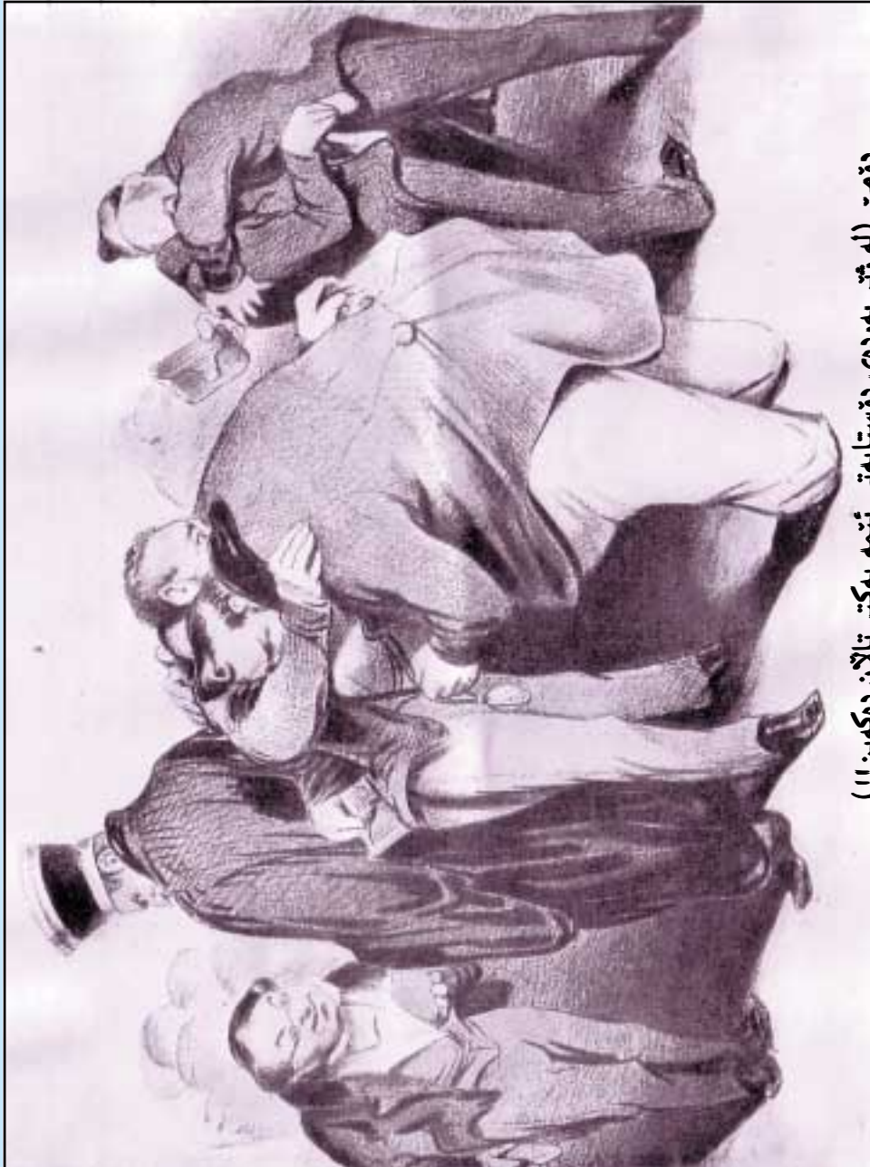
دۆمۈز (لە ژۆر پەردەى دۆستايەتى ئىنمە يەكتەر تالان دەكەين!!)