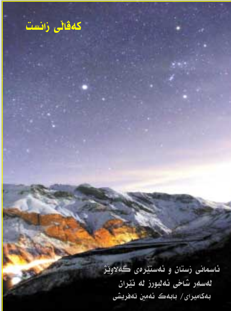
ئاسمانی زستان و ئەستێرە گەلاوێژ لەسەر شاخی ئەلبورز لە ئێران