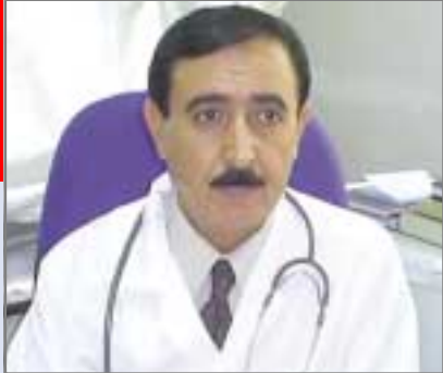
ئاماده‌کردنی: د. فه‌یسه‌ڵ بلباس