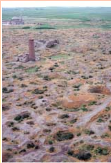
ئاسه‌واری کاولگه‌ شاری قان

کاتیکیدا سوپای عوسمانی له‌ جه‌نگدا له‌به‌رامبه‌ر سوپای عوسمانی له‌ کشانه‌وه‌دا بووه هه‌لساوه به‌ وێرانکردنی ئەم شاره.. کاتی حکومه‌تی روسیای قه‌یسه‌ریش ده‌ستی به لاوێکردن و له یه‌کدارمان کرد له سالی ١٩١٧ ئەم شاره‌یان جێهێشت.