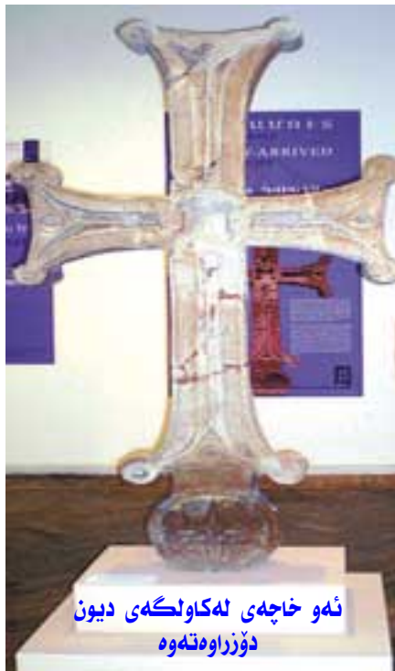
ئهو خاچه‌ی له‌کاولگه‌ی دیون دۆزراوه‌ته‌وه