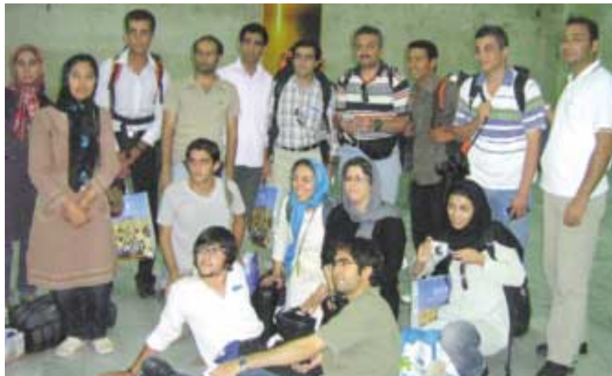
کۆلا‌جی فهله‌کناسی کوردو ئێران له‌یه‌ک تابلۆدا- ۲۰۰۸/۸/۳۰

رۆژ دوا‌ی رۆژ، نه‌ه‌مه‌تیه‌کانی ئاده‌میزاد له‌سه‌ر تاقه هه‌سه‌ره‌که‌ی که ژبان و مانا‌کانی له باوه‌ش ده‌گه‌ریت رووه‌و زیاده‌بوون و فراوانبوونه، شه‌یوازه‌کانی ئه‌م نه‌ه‌مه‌تیه‌نه چه‌ندین ره‌نگ و ئایین و نه‌ژاد و ولاتانی نیوان کۆت و به‌نده‌کانی سنووره‌کانی گه‌رتۆته‌وه‌و هه‌رچه‌نده مرۆف هه‌ولده‌دات خۆیانی لێ رزگار بکات که‌چی ته‌گه‌ره‌کان بی