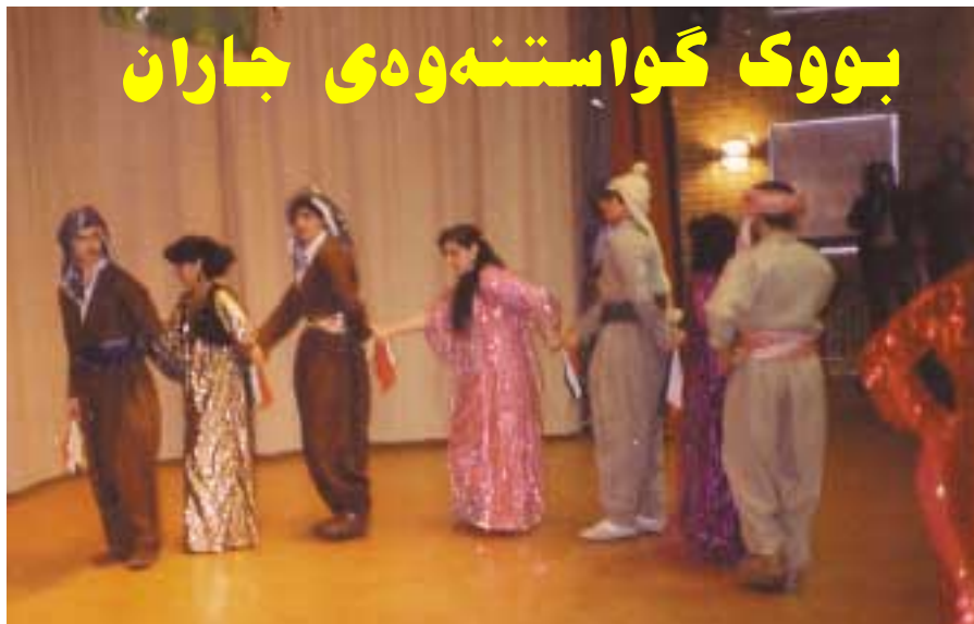
نأ/وێنە: ژبان دزەبی

کاتی کە گوندی مالتیک بۆ کوردەکیان ژبان دەهێنا، پێش گواستنەو هێ خواردنیا ناسراو کرد و چەند مەری گەرەبەیان سەر دەبەری و خۆیان ساز دەکرد و لە هەموو لایەک لە خزم و کەسیان دەگێتێراو هەموو کۆدەبوونەو و رەشمالیان هەلنەدا، ئەو کات تێبێ موسیقا و